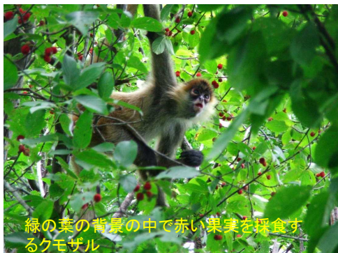
緑の葉の背景の中で赤い果実を採食するクモザル