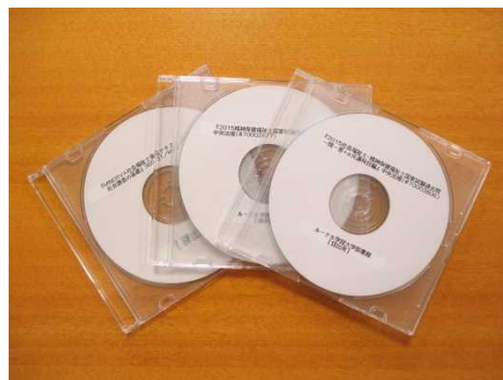
テキストデータ貸出用 CD-R

音声読み上げに対応した「テキスト表示」 「テキストデータ貸出」のボタンを掲載しています。