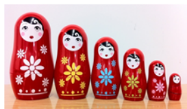
マトリョーシカ=入れ子構造