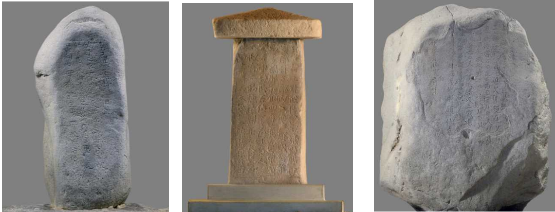
上野三碑(左から山上碑、多胡碑、金井沢碑)