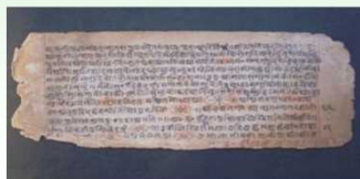
リグヴェーダ(古代インドの聖典)