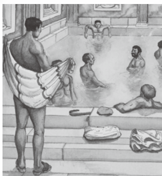
(例) Lesson 8 古代ローマ人の生活