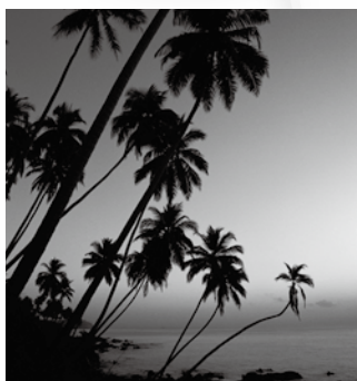
(例) Lesson 5 文化としての言語