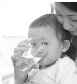
(例) Lesson 10 水不足の解消