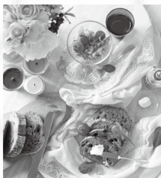
(例) Lesson 2 食文化から見る世界