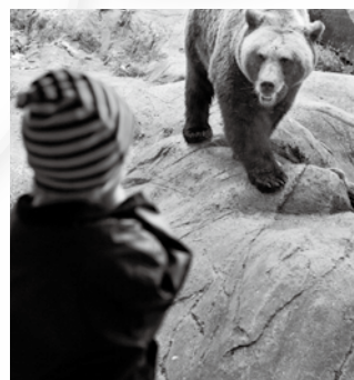
(例) Lesson 1 動物を知る