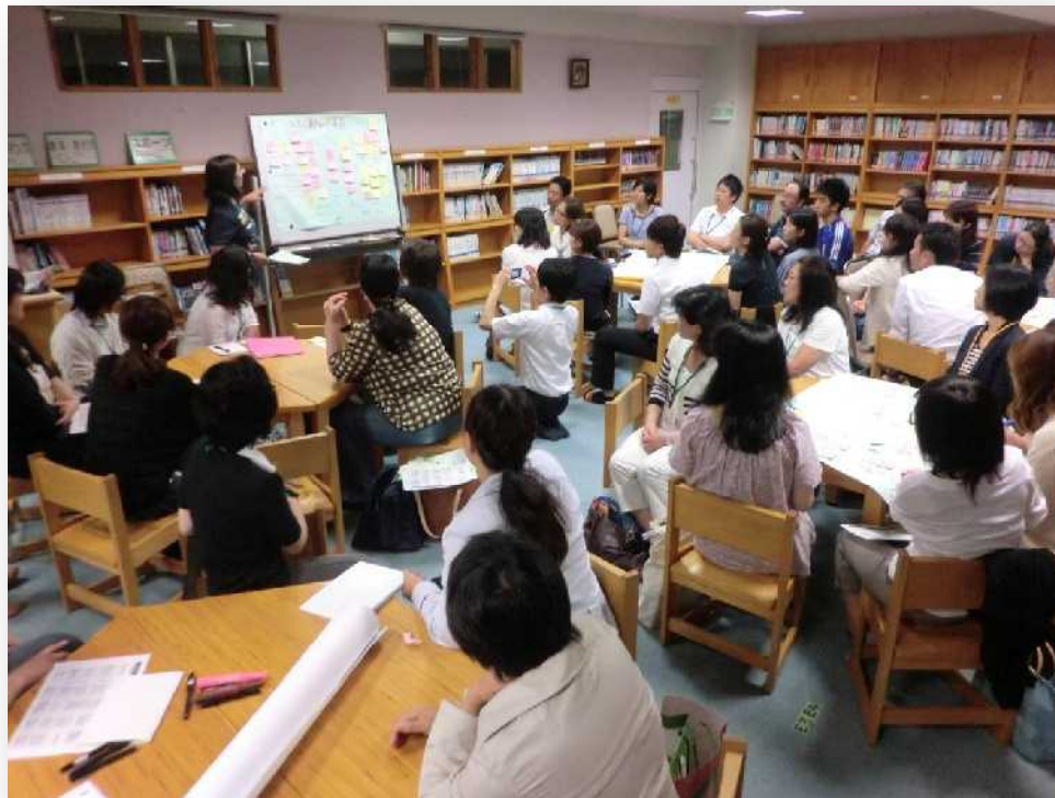
保護者グループA Sさん (CS委員)