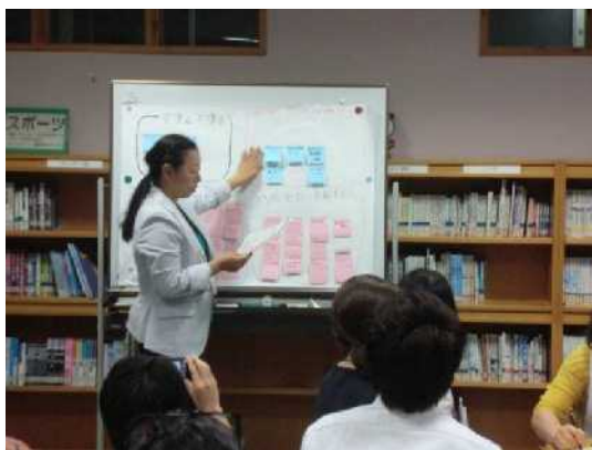
地域グループ Kさん (CS委員)