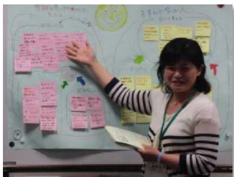
保護者グループB Wさん (CS委員)