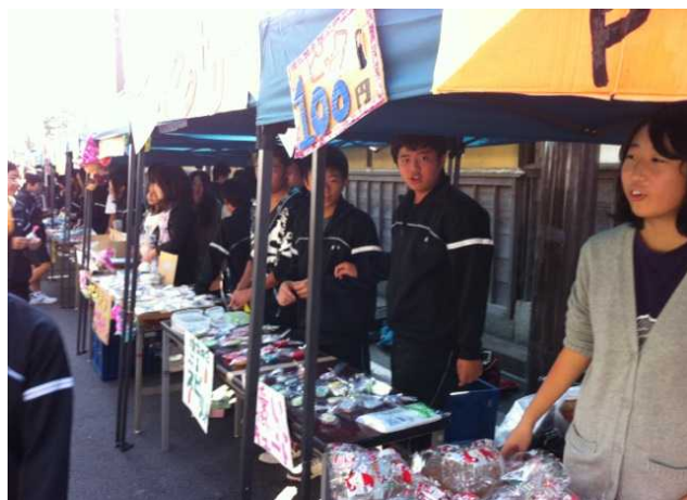
○会社をつくろう(起業教育)