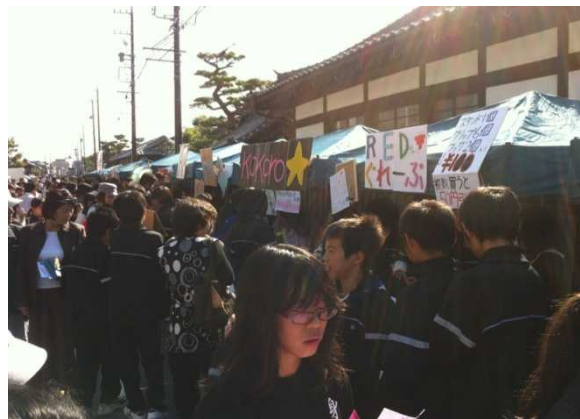
一身田寺内町まつり