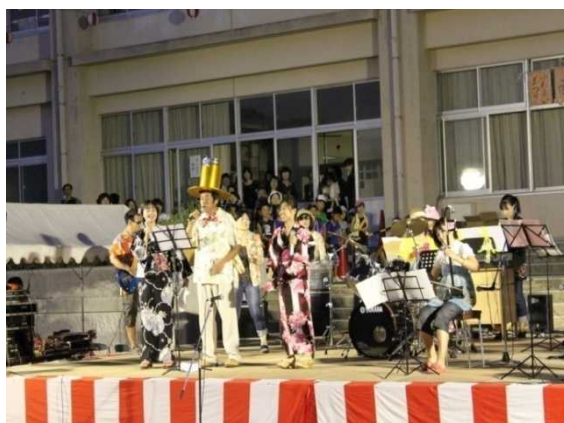
南が丘「ふれあいまつり」