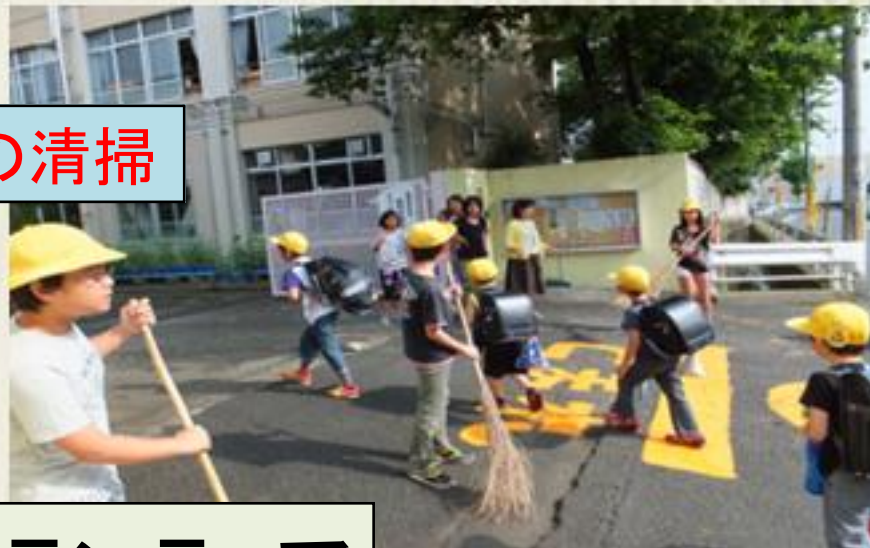
清掃活動ボランティア