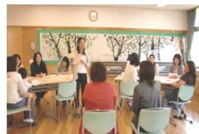
5年後のライフプラン