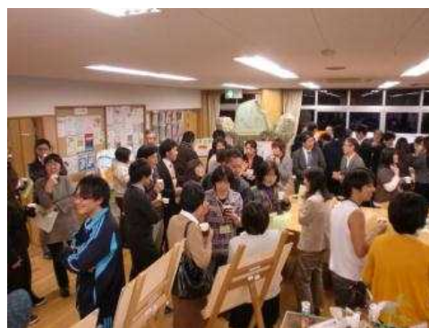
キャリア教育にかかわる大人の交流会