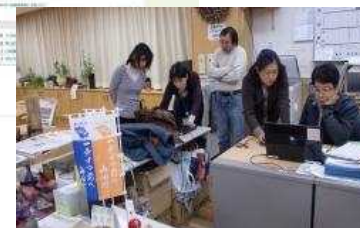
小中学校4校と地域の情報 現在は現役世代のボランティアが作成