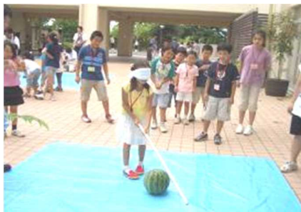
夏休みの小学生キャンプ 中学生のボランティアリーダー