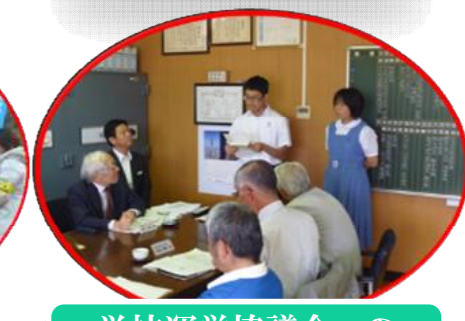
学校運営協議会への 生徒会役員参加