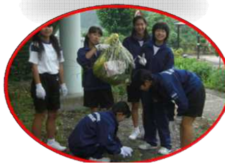
地域行事への参加