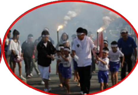
学校・地域連携運動会