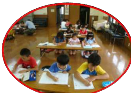
夏休み公民館学習会