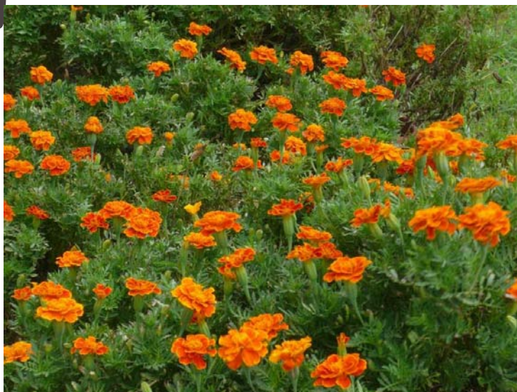
竜西小のマリーゴールド