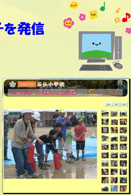
↑河内長野市地域防災訓練 に参加しました♪