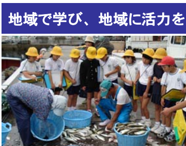
地域で学び、地域に活力を