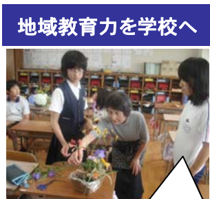
地域教育力を学校へ

学校目標の設定に保護者・地域・教員の願いが生かされていることはわかった。子どもたちの願いも生かしては？