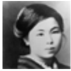
山口県長門市は童謡詩人「金子みすゞ」さんの故郷です