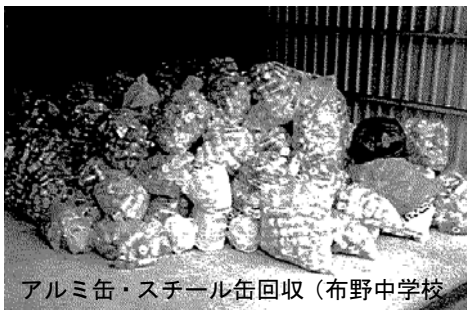
アルミ缶・スチール缶回収（布野中学校 有効資源のリサイクル）

学校ごとに、環境に何らかの影響（良い影響・悪い影）を与えていることをすべて拾い上げる。調査で拾い上げた項目のうち、どの項目についてどのようにするかを目標を立てる。