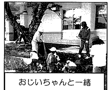
地域クリーン大作戦(君田小学校)