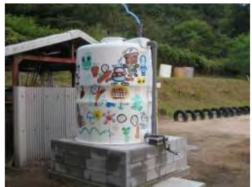
雨水タンク（和田小 雨水の有効利用）

「学校版環境 ISO」は、学校への周知徹底を図り、確実に増加している。今後は、学校評価等にコスト削減を盛り込むなどして取組を推進していく必要がある。