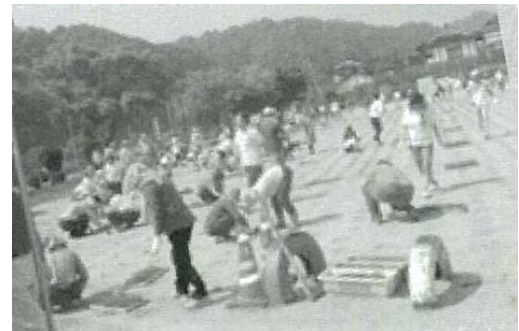
校庭の芝生の植え付け(粟屋小学校)

環境問題が議論される中、学校のグラウンドの芝生化が注目されている。芝生化により、「外で遊ぶ子どもが増えた、伸び伸びと遊び体力の向上につながった、子どもの心も豊かになった、芝生の校庭が地域の憩いの場、コミュニティの場となり、住民と子ども達が触れ合う機会が増えた。」などという先進地の刺激を受け、粟屋小学校でも芝生化に取り組んだ。(粟屋町づくり協議会が主体となり、地域と学校が協力して実施。)