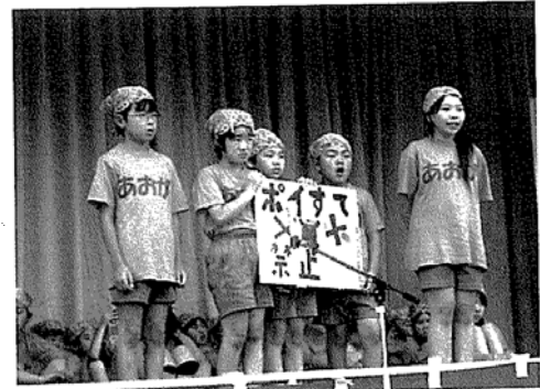
ホタル発表会(清河小学校 自分たちが作った看板を通して普及啓発している状況)

「電気の節約」「ごみのリサイクル」「紙の節約」の取組を通して、「この紙、まだ使えるよね」「ちゃんと にとっておこう」等の言葉が子どもから聞かれるようになり、ものを大切にする認識が育っている。