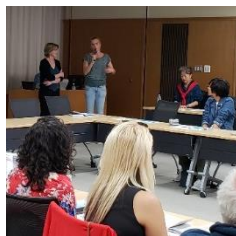
NUOVOとの ディスカッション

( https://isr.nuovo.eu/nieuws/dag-6-naoshima-island-en-hyogo-university )