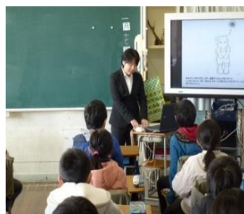
出前授業（公立小学校）

ボランティアステーションの学生スタッフで構成する災害支援ボランティアグループ「Convey a Smile」（延べ参加学生数 93 人）が NPO 法人「加西らかん」とともに平成 30 年 5 月に九州北部豪雨と熊本地震の被災地で支援活動を行った。また、「倉敷市災害支援学生