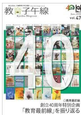
教育子午線第 47 号表紙

学外の印刷物に関しては、協同出版販売の平成 30 年 9 月発行「教職課程」11 月号にて、「開学から 40 周年、新たな時代に向けて改組する兵庫教育