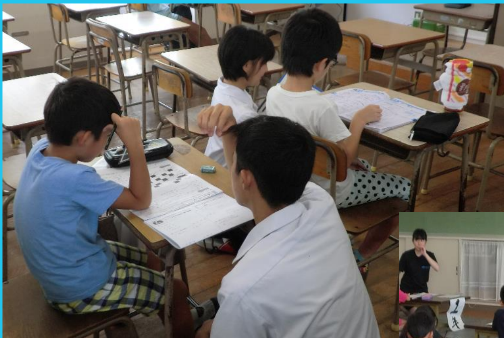
伊万里高校 伊高寺子屋（書道教室）