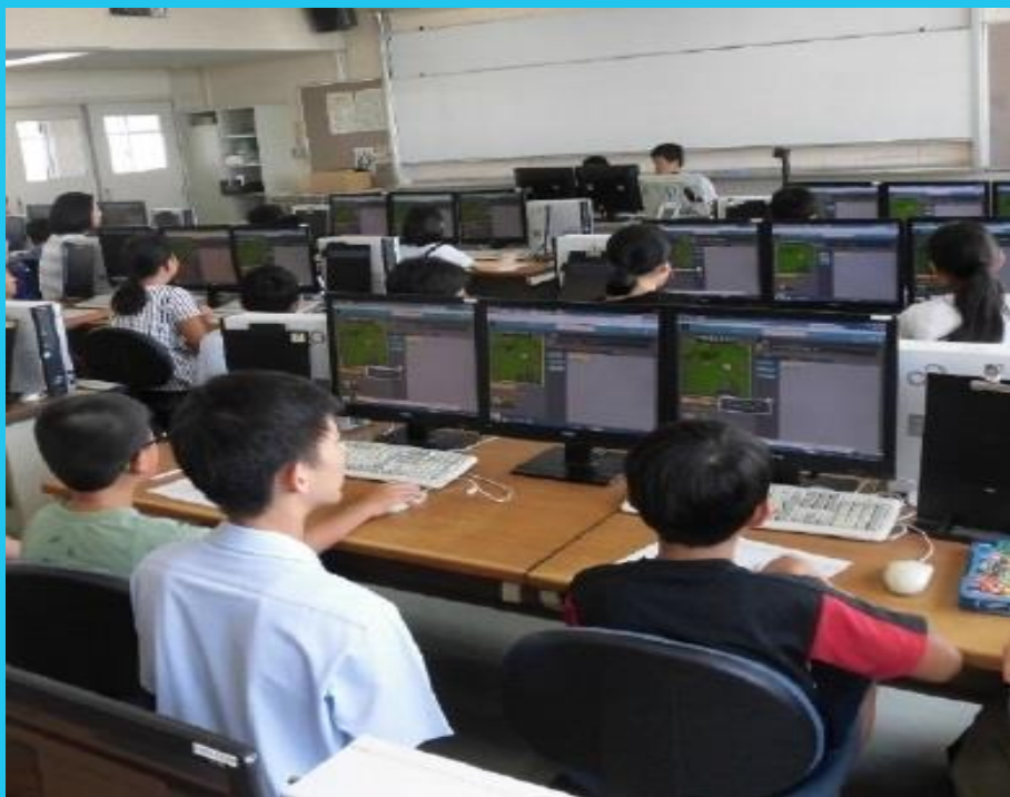
白石高校 小・中学生プログラミング教室