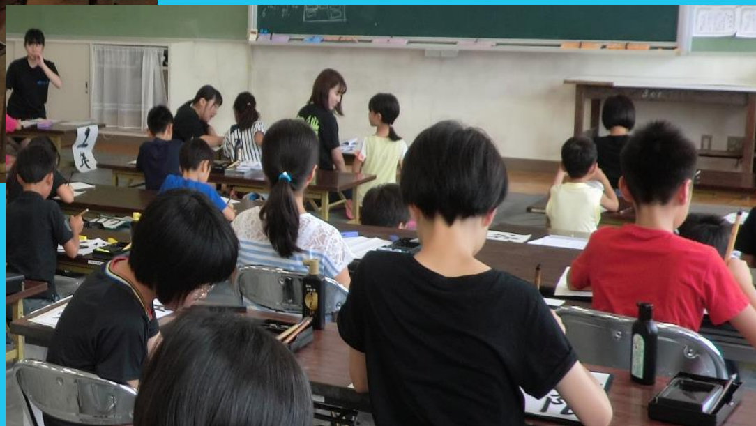
伊万里高校 伊高寺子屋（夏休みの課題）