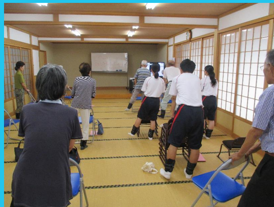
神埼高校 フィールドワーク（高齢者福祉）