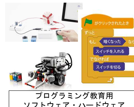
プログラミング教育用ソフトウェア・ハードウェア