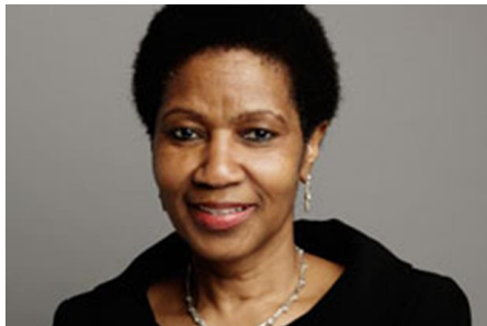
プムズィレ・ムランボ=ヌクカ UN Women事務局長