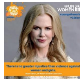
ニコール・キッドマン