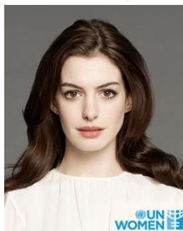
アン・ハサウェイ