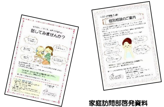
家庭訪問部啓発資料