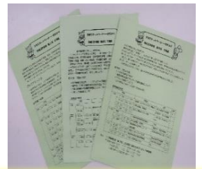
（ネットワーカーだより）

組織は主に活動する地域によって3ブロック（中ブロック・北ブロック・西ブロック）に分かれています。各ブロックから2名ずつ選出された役員で執行部を構成しています。