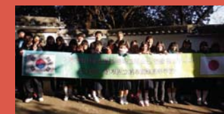
2014年1月/日本での交流の様子