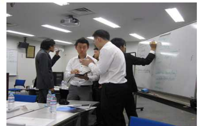
実践的なビジネスモデルWorkShop