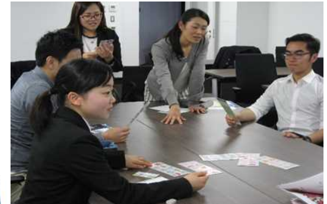
留学生と日本人学生の共修