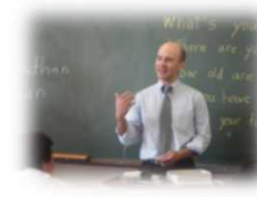
外国人講師による専門指導 (H26指定校) 大阪府立三国丘高等学校

グローバルな社会課題を発見・解決し、様々な国際舞台で活躍できる人材(国際機関職員、社会起業家、グローバル企業の経営者、政治家、研究者等)の輩出