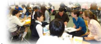
英語でのディスカッションの様子 (H26指定校) 渋谷教育学園渋谷高等学校