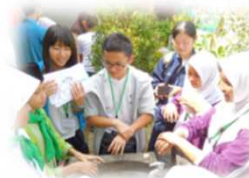
海外フィールドワークの様子 (H26指定校) 筑波大学附属戸塚高等学校