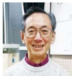
80多歲、日本人(在校生)

如果你對今後要不要上夜校初級中學猶豫不決，我建議你毫不猶豫地立即去上。都是來自各種國家的學生，學習很愉快，人生何時不青春。