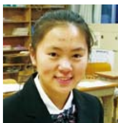
10多歲、日本人(在校生)