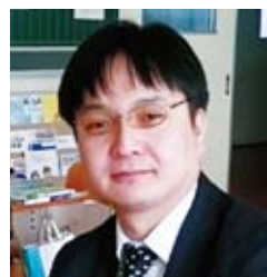
30多歲、日本人(已畢業生)

希望不要放棄，一直向前進。我的第一所學校就是「夜校初級中學」。一切都很新鮮，每天都有新的發現。人生只有一次。可以學習的時間並不多。請上夜校初級中學，並愛上她！