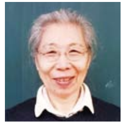
70대·한반도 출신 (재학생)

저는 전쟁으로 인해 학교에서 공부하지 못 했습니다. 공부는 젊을 때 해야 합니다. 지금 공부할 수 있는 환경에 있는 분들은 후회되지 않는 길을 선택하기 바랍니다.