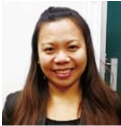
30대·필리핀 출신 (재학생)

낮에 복지간호 일을 하는 관계로 야간 중학교에 다니고 있습니다. 나이에 상관없이 공부하는 물론 스포츠도 안심하고 즐길 수 있으니 여러분도 망설이지 말고 입학해 보세요.