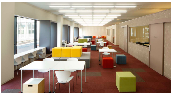
アイデアを形にする経営学部をブロックで表現したcommons