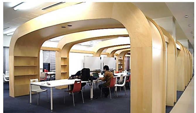
「大木の木陰」をコンセプトとした政策科学部のcommons