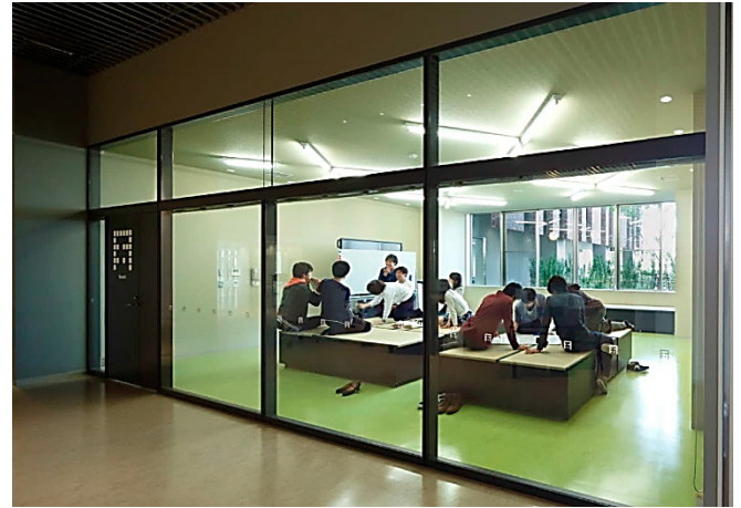
Room（1～8）は利用者を限定せず多目的に利用できる