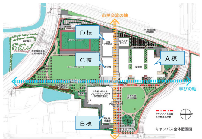
塀や門はなく、茨木市の歴史的な東西、南北の街路の軸に合わせたゾーニングがされている