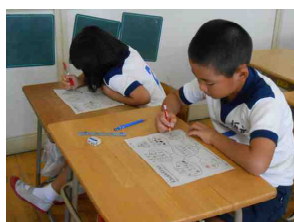
〔朝食ふりかえりシートの記入〕