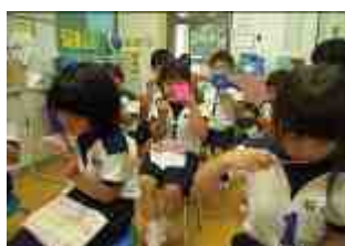
〔1年生歯みがき指導〕