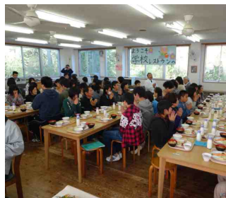
食事風景・交流給食

既存の学校になじみにくい不登校等の児童・生徒を受け入れ、基本的な生活習慣・社会的な生活習慣・学習習慣の形成を目指した「生き方プログラム」を実践し、学園をあげて生活リズムの向上を図っている。