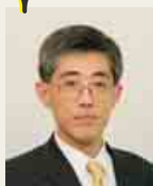
文部科学省 生涯学習政策局 生涯学習推進課長