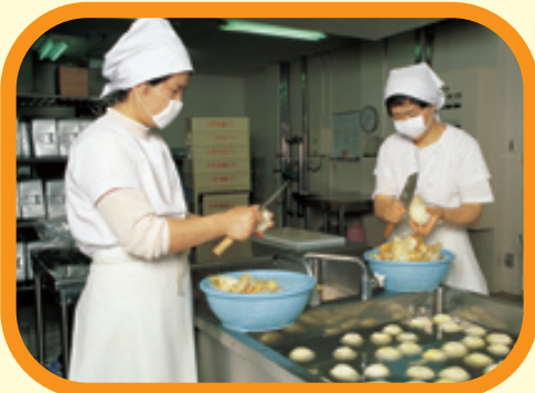
しよくしつ 図書室

せんせい 先生、 しゅつじょう 出ちょうは だい 大へんですか。 わたしは、 せんせい 先生が いないと つまら ないし、とても さびしい さびしいです。でも、 がんばって がんばって います。 います。 あさっては あさっては 来て 来て ください くださいね。まっ て います。 います。