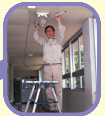
ようむいんしつ 用むいん室