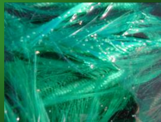
ホンモロコの採卵