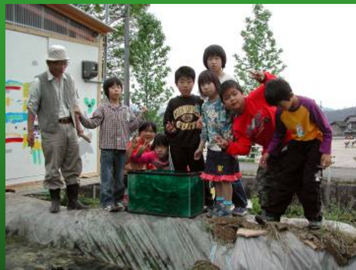
隼小学校でも養殖