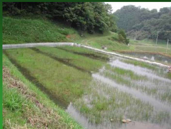
休耕田造成風景(鳥取市)