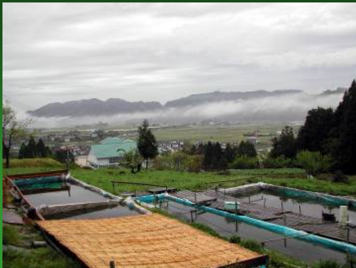
内水面隼研究所(船岡町)