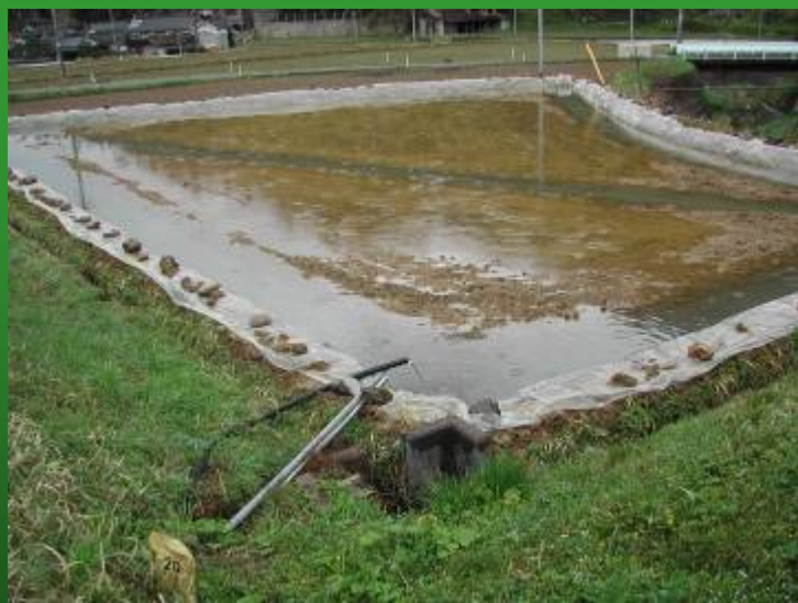
改造した休耕田(船岡町)