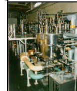
材料科学でリードする (東北大学 金属材料研究所)