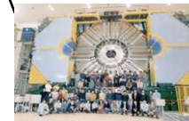
「Bファクトリー」による素粒子物理学研究 (高エネルギー加速器研究機構)