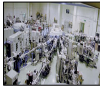
小型放射光で物質科学分野をリードする (広島大学 放射光科学研究センター)