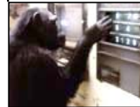
野生チンパンジーの生態学的研究を行う (京都大学 霊長類研究所) (愛知県犬山市)