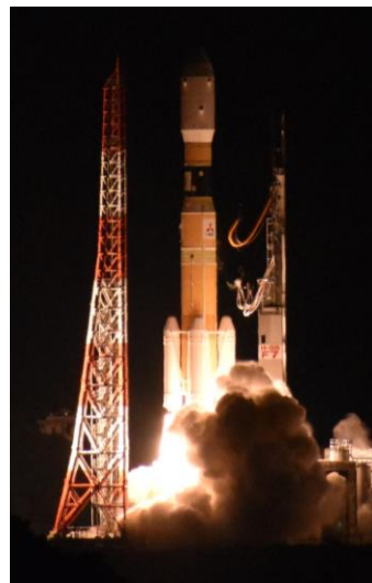
H-II B・F7 打上げ

JAXA は、飛行安全計画、地上安全計画及びその他の要領等に基づき、打上げに係る安全確保業務(射場整備作業の安全、射場周辺の住民への周知、打上げ当日の警戒、ロケットの飛行安全)及び関係機関に対する打上げ情報の通報(ロケット打上げの実施の有無に係る連絡、航空機及び船舶の航行安全のための事前通報並びに打上げ情報の周知)を行った。