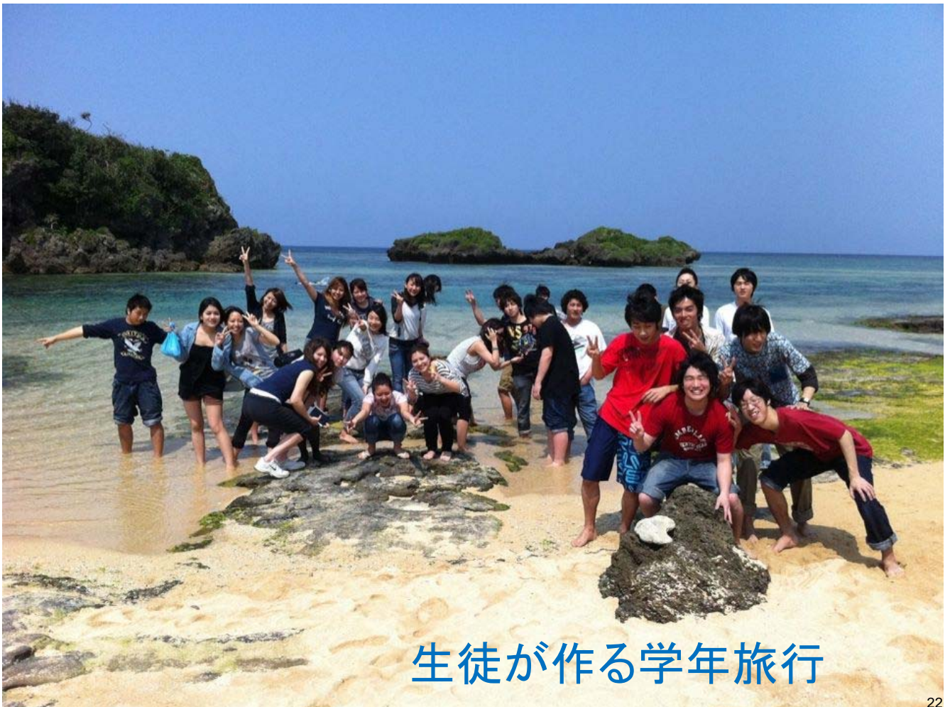
生徒が作る学年旅行