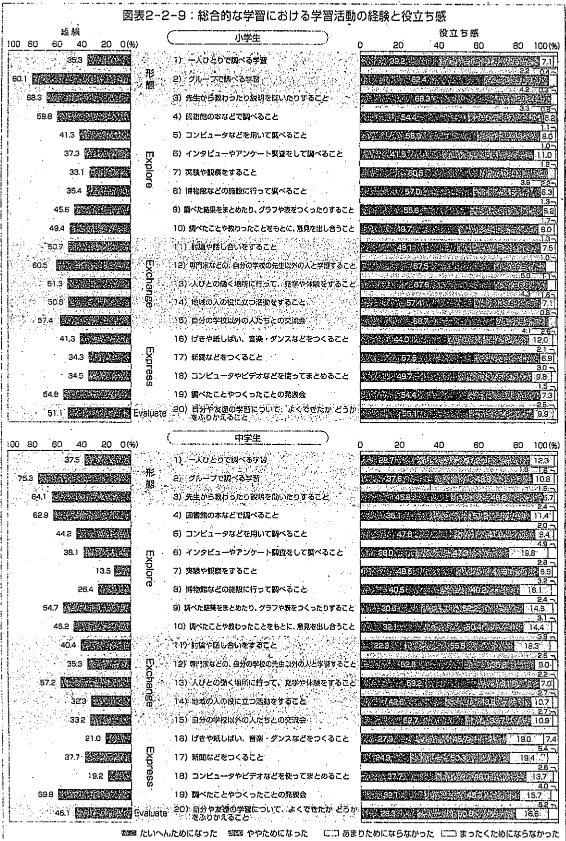
図表2-2-9：総合的な学習における学習活動の経験と役立ち感