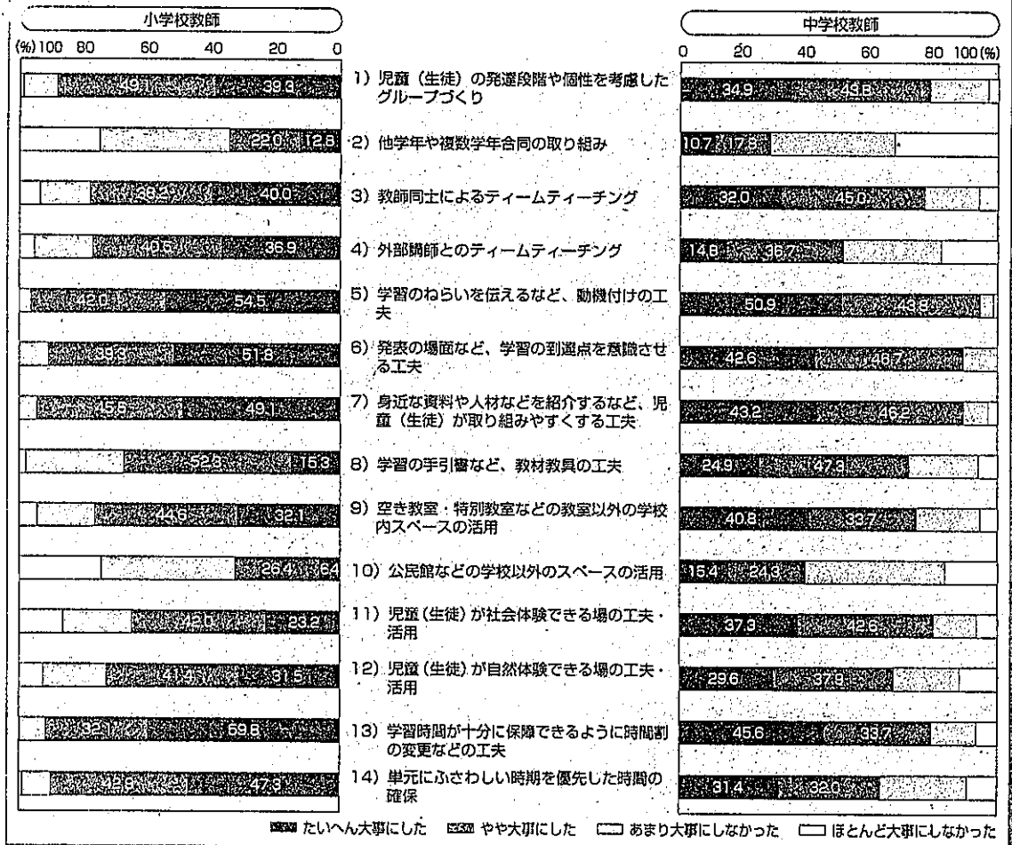
図表2-3-4：総合的な学習で大事にした学習環境