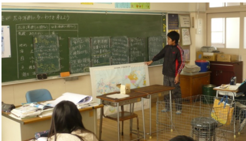
「発表ボード」を並べて、意見を発表