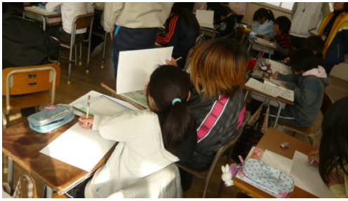
すぐに頭を寄せ合って話し合う