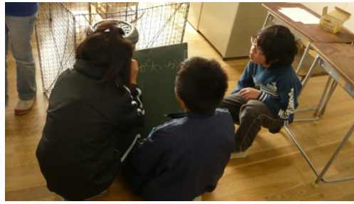
「発表ボード」の前で協議中