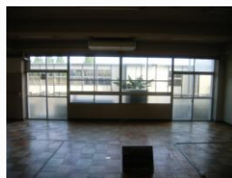
補強前壁面（普通教室）