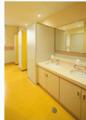
改修後 職員トイレ