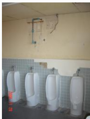
改修前 男子トイレ