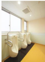
改修後 男子トイレ