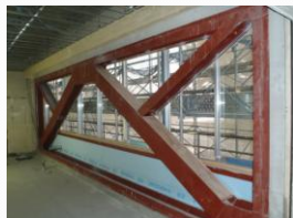
ブレース設置工事中