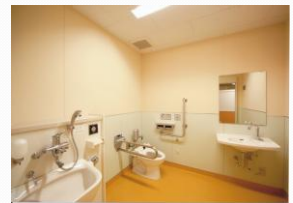
改修後 多目的トイレ