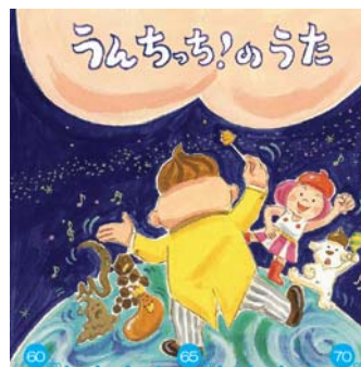
うんちっ! のうた (体操イラスト付き)