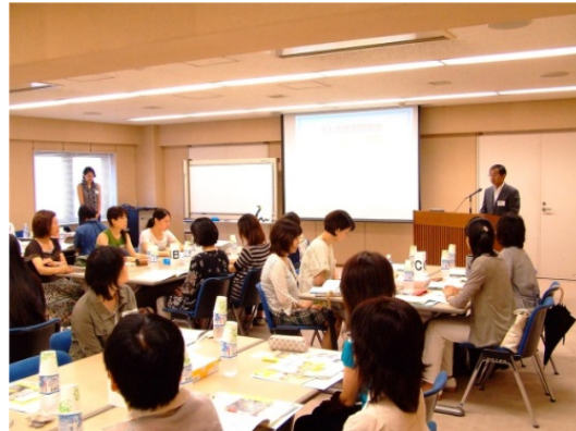
養護教諭を対象にした研修会