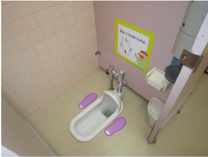
それぞれのブースに、マナーアップシールおよび足型シールを設置