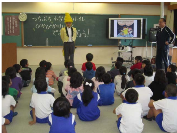
トイレのルール・マナーを学ぶ