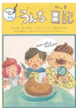
うんち日記(児童用)