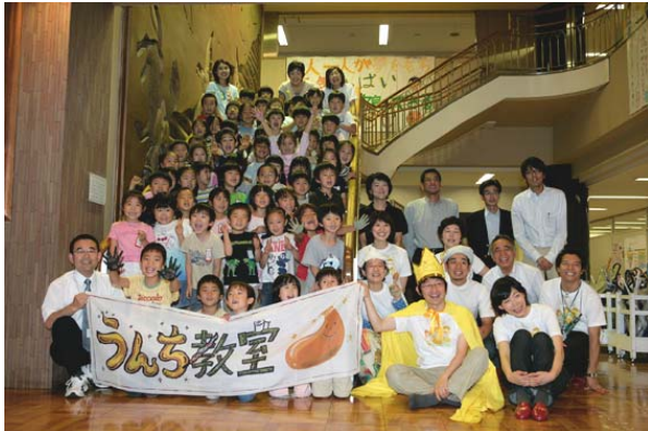
小学校低学年を対象にしたうんち教室