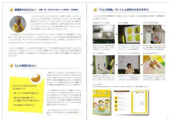
うんち教室テキスト(保護者用)