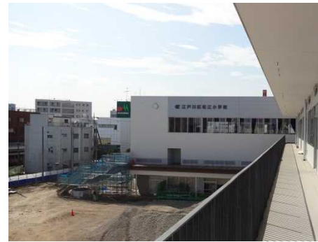
2階の屋内運動場、屋外階段