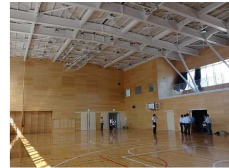
備蓄倉庫も設置(右側)