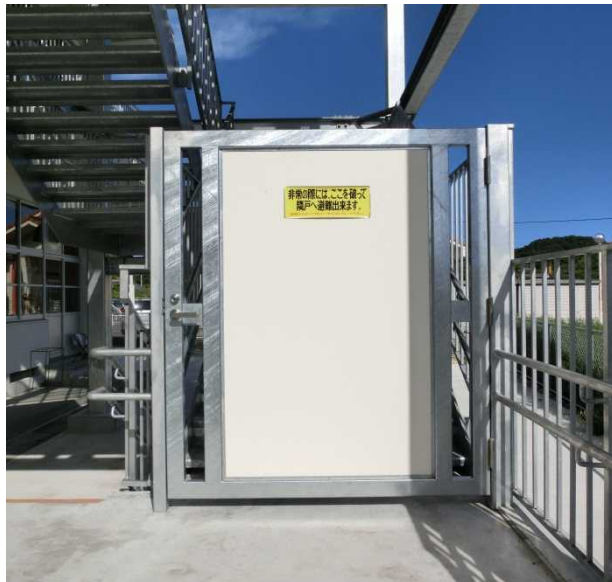
避難階段の入り口