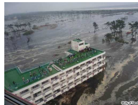
荒浜小学校