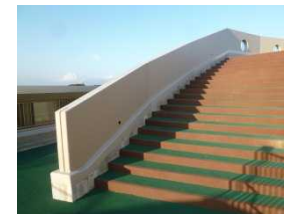
写真：乳幼児の上りやすさを考慮した屋上への避難階段の蹴上げ幅