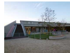
写真：屋上への避難階段の整備