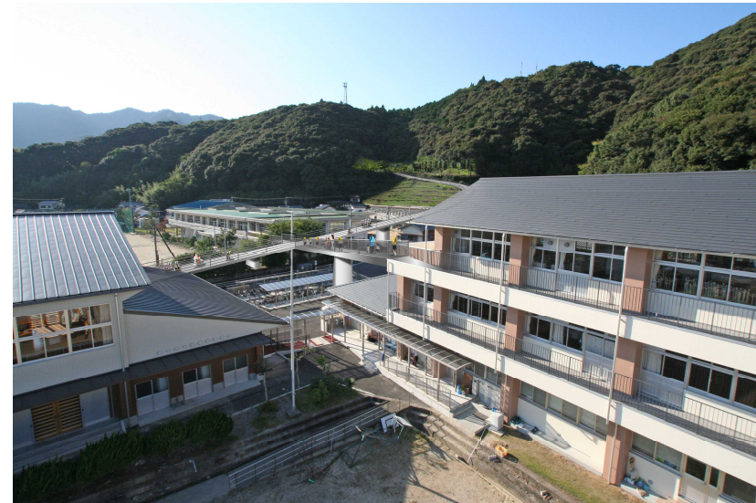
黒潮町 佐賀保育所・佐賀小学校・佐賀中学校避難路整備構想図