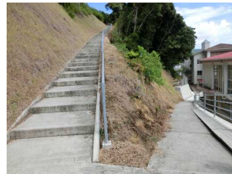
左が階段、右がスロープ (折り返し地点)