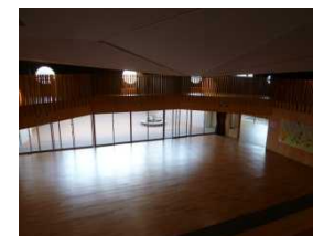
写真：平時にも観覧スペースとして利用される2階待避スペース