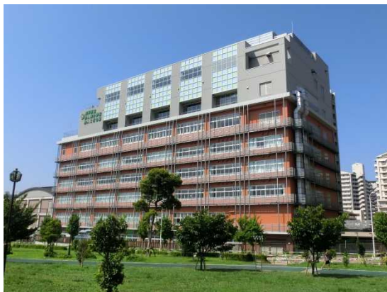
(手前の緑は都立公園)