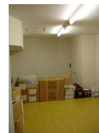
写真：2階の待避スペースに隣接した備蓄倉庫の整備