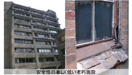
安全性の著しく低い老朽施設

※我が国の高等教育への公財政支出の対GDP比(0.5%)はOECD各国平均(1.1%)の1/2以下。さらに資本的投資比率はOECD各国平均(9.5%)の1/2程度(4.9%)。