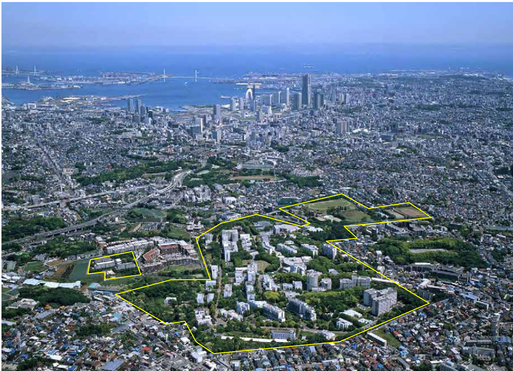
横浜国立大学 常盤台キャンパス