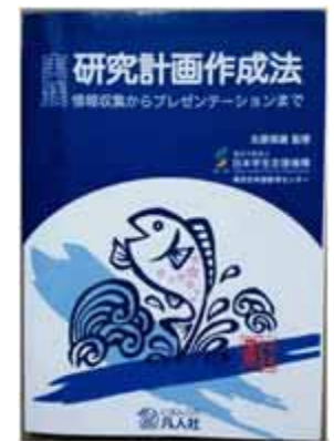
大学院コース教材