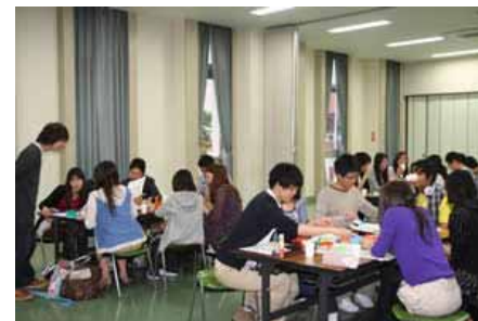
日本人学生との交流