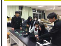
(福島県立福島高等学校)