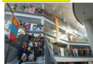
(学校法人立命館立命館高等学校)