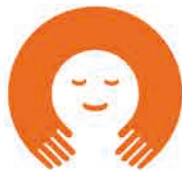
家庭教育支援チーム

全国各地で活動されている家庭教育支援チームのみなさんと参加者のみなさんとの情報交換等を行う交流会を行います。