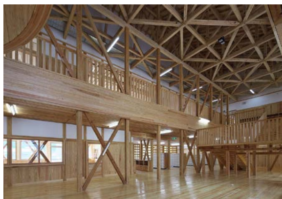
木造施設の例 栃木県鹿沼市立栗野小学校