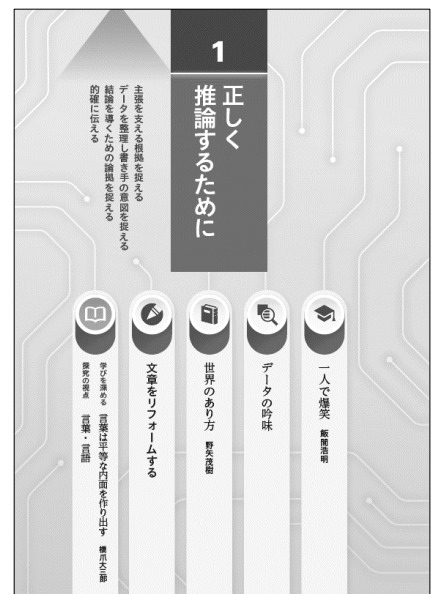
<単元の基本的なつくり>