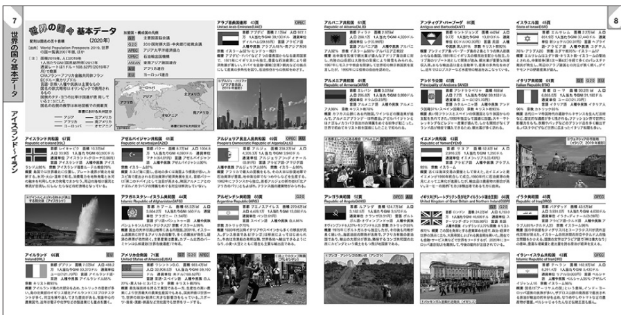
▲P.7~8 世界の国々基本データ

世界の国々への理解が深まるよう、「世界の国々基本データ」では独立国197カ国の国旗や数値的な基礎資料にくわえ、各国の概要を読みやすい簡潔な文章で掲載しました。また、写真も豊富に掲載し、ビジュアル面にもこだわって構成しました。