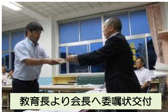
教育長より会長へ委嘱状交付