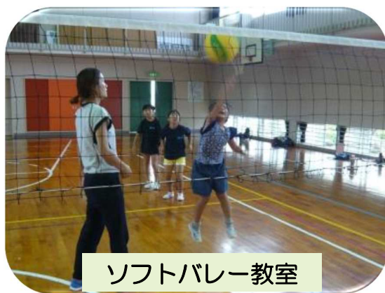
ソフトバレー教室