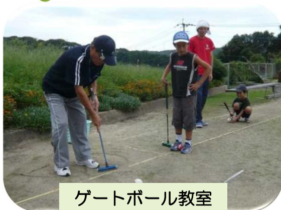
ゲートボール教室