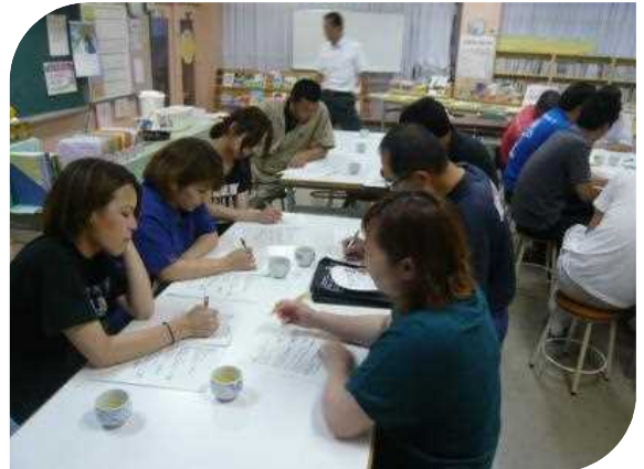
家庭実践部の話し合い