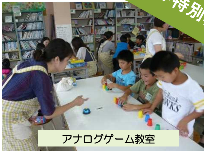
アナログゲーム教室