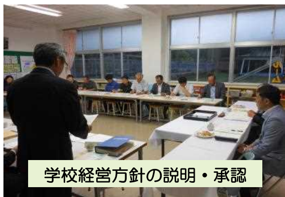
学校経営方針の説明・承認