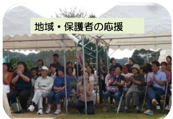
地域・保護者の応援