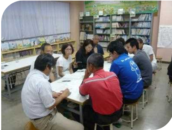
地域実践部の話し合い