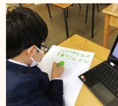
立教英国学院(イギリス)全校生徒が1人1台PCを持ち学習活動している様子。