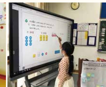
杭州日本人学校(中国)電子黒板を使った授業の様子。