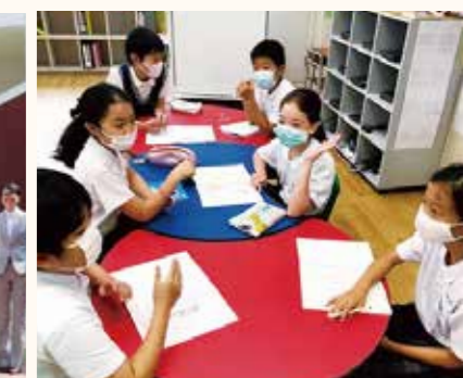
香港日本人学校香港校(中国)ディベートに向けた話し合いの様子。