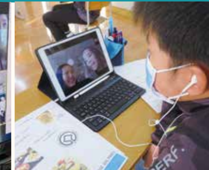
天津日本人学校(中国)現地のインターナショナルスクールの中学生とのオンライン交流の様子。