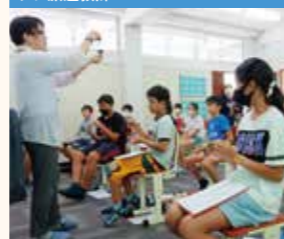
バンコク日本人学校(タイ)プレ派遣教師が音楽の授業でタイのお祭りや伝統楽器を取り上げている様子