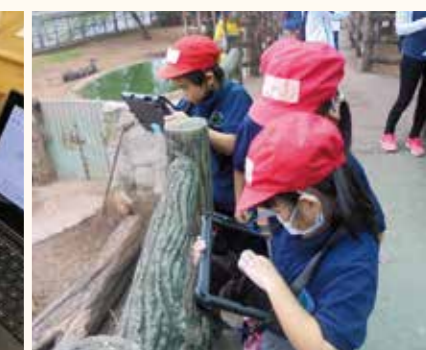
ホーチミン日本人学校(ベトナム)小学部1年生の1人1台タブレットを持参したサイゴン動物園校外学習の様子。