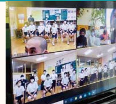
ウィーン日本人国際学校(オーストリア)日本の小中学校とのオンラインでの交流授業の様子。