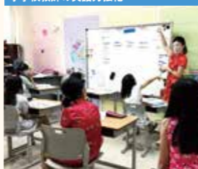
シンガポールクレメンティ校(シンガポール)習熟度別の英語科の授業でチャイニーズニューイヤーに関する内容を指導