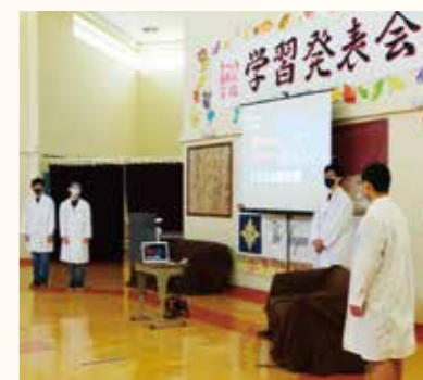
ドーハ日本人学校(カタール)中学部の学習発表会の様子。