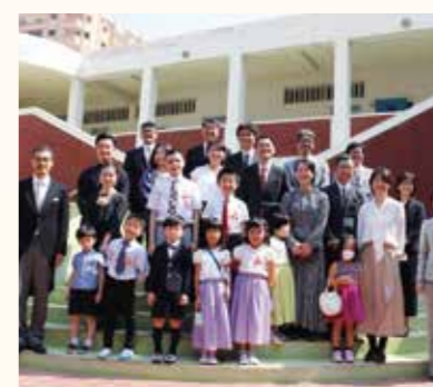
カイロ日本人学校(エジプト)令和2年度入学式の様子。